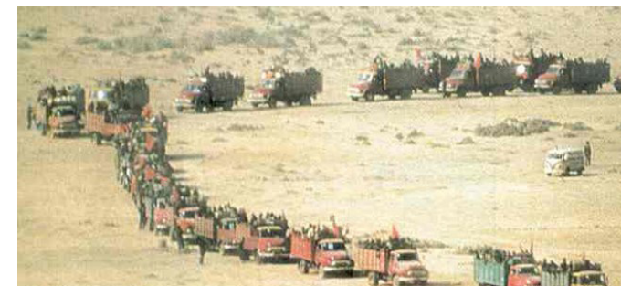
Der sogenannte Grüne Marsch - Marokko besetzt Westsahara 1975

Die Erde keucht hier nicht nur vor Hitze. Sehen Sie nicht weg. Jeder ist gefordert, etwas zu tun. Unterschreiben Sie die Petition „Der Fisch schwimmt woanders“, setzen Sie sich für die politischen Gefangenen in Marokko ein, fordern Sie Ihre Abgeordneten auf, für die Menschenrechte und das Selbstbestimmungsrecht der saharaurischen Volkes einzutreten. Ermöglichen Sie Kindern aus den Flüchtlingslagern einen Ferienaufenthalt fernab der unwirtlichen Lebensbedingungen oder spenden Sie Schulbücher und damit Zukunft. Die grausame Mauer der Schande in der Wüste muss fallen. Vergessen Sie nicht die Menschen der Westsahara.