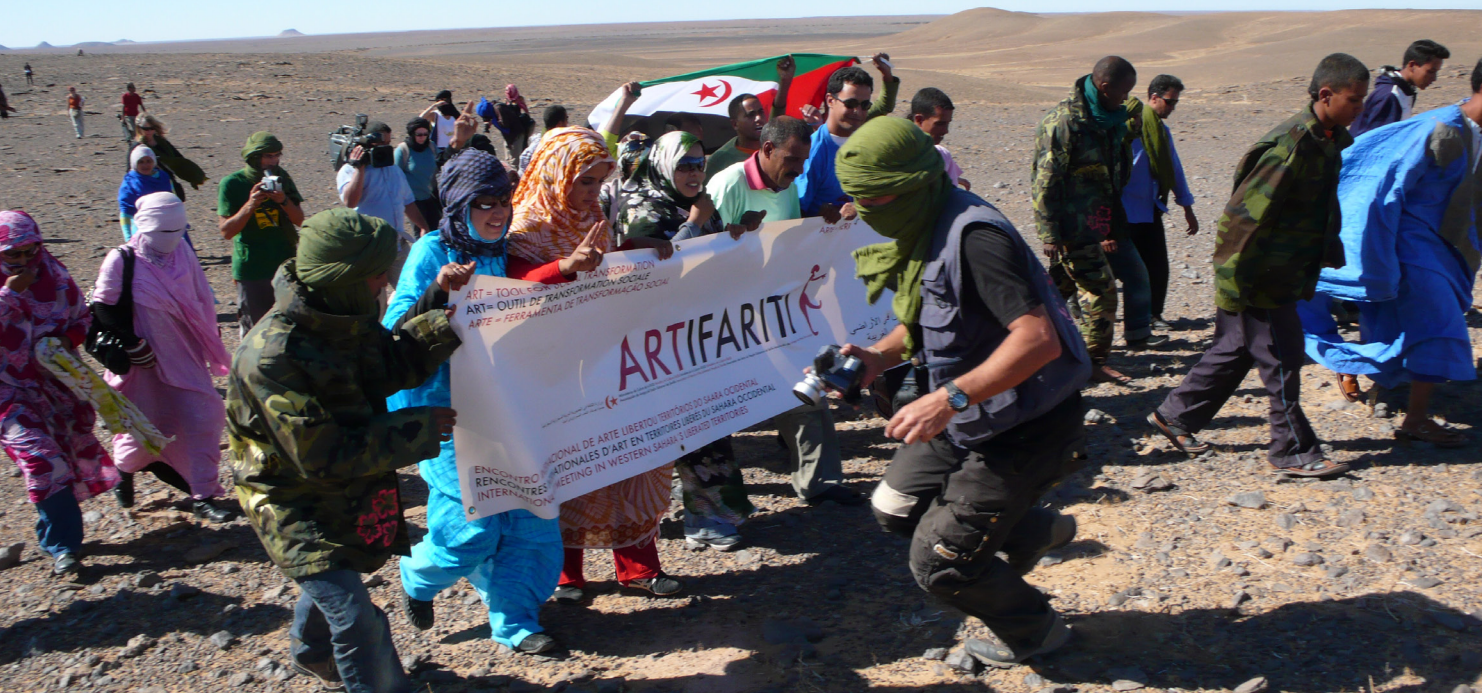
Demonstration an der "Mauer der Schande" mit TeilnehmerInnen von Artifariti 2009